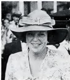
Preferensia: Aruba den Reino . . .

E komishon, ku ekshon di e miembro Croes, ta haña ku no por rekomendá un status aparte of asioshion di Aruba como periodo transitorio pa su independensia, si Aruba no partisipa na un koperashon "estrecho i duradero" ku Antias Hulandes den cuadro di un "Unie" a base di un konstrukshon manera por ehempel deskribt den e Nota Voges (wak 5.1.1.) . Si un preparashon planifiká asina, di e independensia di Aruba no ta posibel, lo ta miho pa Aruba